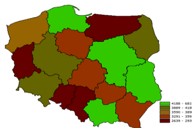
Łączna długość dróg w 2015 (km)